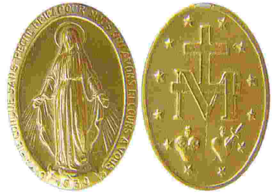
In senso orario, un bozzetto del 1954 per la bandiera europea; la "medaglia miracolosa" di rue du Bac; il teologo Romano Guardini