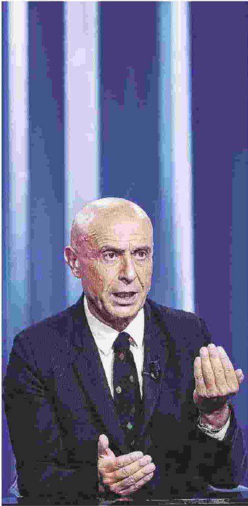
L'ex ministro dell'Interno Marco Minniti