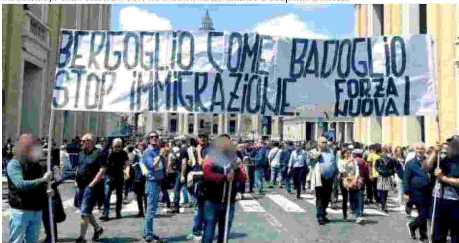
Lo striscione di Forza Nuova a Roma. I volti sono stati oscurati dagli stessi militanti