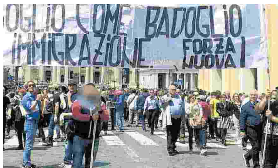
Ritaglio stampa ad uso esclusivo del destinatario, non riproducibile.

poi detto di aver «contestato duramente Jorge Bergoglio, paragonandolo a Badoglio perché simbolo universale del tradimento più vergognoso». Forza Nuova ha poi annunciato, sempre via social, nuove manifestazioni per oggi alle 15 quando a Roma, all'università La Sapienza, ci sarà il sindaco sospeso di Riace Mimmo Lucano per una conferenza. «Oggi è toccato a Jorge Bergoglio — hanno scritto — domani toccherà a Mimmo Lucano. Poi sarà il turno di media, toghe militanti e politici venduti a Bruxelles». Il Papa è stato attaccato anche sui social con post inferociti per la sua iniziativa di incontrare la famiglia rom intestataria della casa popolare nel quartiere romano di Casal Bruciato. Alla famiglia aggredita il Papa aveva detto: «Prego per voi, vi sono vicino. Soffro per quanto vi è capitato, questa non è civiltà». Per le sue parole, papa Francesco è stato tacciato di «non essere un vero Papa», in molti post si rimpiange il papa emerito Benedetto XVI e a Bergoglio è rivolto il peggior campionario di insulti, maledizioni e false affermazioni propri degli odiatori seriali.