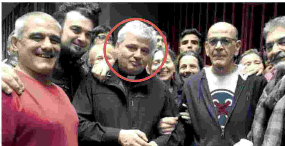
Al centro, Padre Konrad con i residenti dello stabile occupato a Roma

compito. Io non ho famiglia, sono un semplice sacerdote, offrire il mio appartamento non mi costa nulla». Krajewski, un passato da elettricista, divenne sacerdote a 25 anni dopo una laurea in teologia presso l'università di Lublino. Incrociò giovanissimo Giovanni Paolo II quando, non ancora sacerdote, organizzò la liturgia in occasione della visita del Papa a Łódź. Poco dopo, ordinato prete, venne chiamato a Roma nell'Ufficio per le celebrazioni liturgiche. Fu uno dei pochi ammessi nella camera di Wojtyła, che lui considerava già santo, al momento della morte. Poté vestirlo insieme a tre infermieri. Francesco lo trovò nel servizio liturgico una volta eletto Papa. E da lì lo dirottò a quello che è uno degli uffici più importanti della Curia romana.