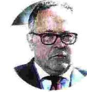
BENOIT COEURÉ Già nel Comitato esecutivo Bce, francese, ha sostenuto la linea pragmatica adottata da Draghi