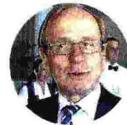
ERKKI LIIKANEN Ex governatore della Banca di Finlandia, più tecnico e meno politico del connazionale Rehn