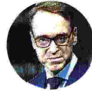
JENS WEIDMANN Presidente della Bundesbank, contrario al Qe e al piano Omt di Mario Draghi