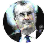
FRANCOIS VILLEROY Governatore della Banca di Francia, parla tedesco ed è apprezzato da Berlino