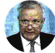
OLLI REHN Governatore della Banca di Finlandia. è stato commissario Ue agli Affari economici