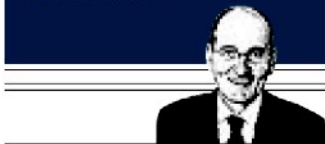
di Nando Pagnoncelli

L a fiducia nell'Unione Europea da parte degli italiani si mantiene su livelli piuttosto bassi (36%), soprattutto se raffrontati al passato (nei primi anni 2000 superava l'85%) e in confronto ai valori espressi dagli altri Paesi europei (siamo quintultimi tra i 28). L'indice di fiducia, calcolato escludendo coloro che non si esprimono, si attesta a 40 e fa segnare una lieve crescita (+2) rispetto al biennio 2017-2018. La frattura tra fiducia e sfiducia è soprattutto di carattere politico: la prima infatti prevale solo tra gli elettori di centrosinistra (71%), mentre la sfiducia prevale nettamente tra i pentastellati (69%) e i leghisti (68%), come pure tra gli elettori dell'opposizione di centrodestra (59%) e gli astensionisti (47%).