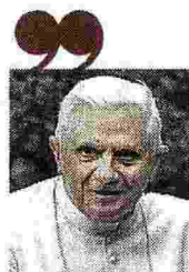
Benedetto XVI 91 anni