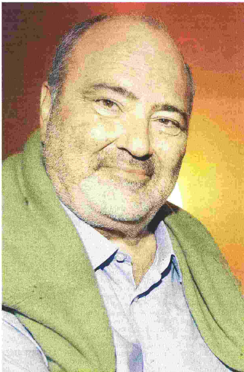
KING MAKER Goffredo Bettini. Dopo la fine del Pci, tre anni di depressione