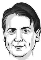
Giuseppe Conte è presidente del Consiglio dal 1° giugno 2018