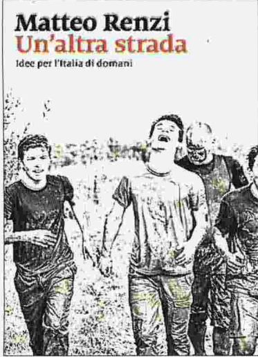
DA DOMANI La copertina del volume