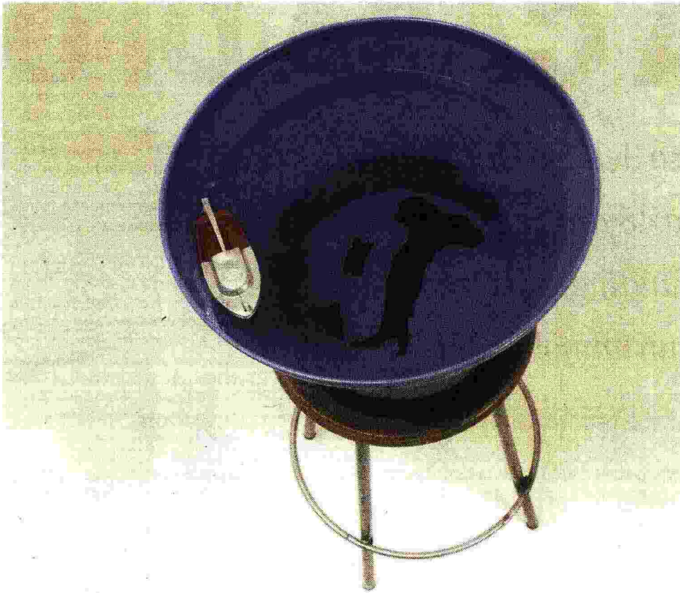
Un'opera di Innocente

L'«autonomia differenziata» è il più vasto e radicale progetto antimeridionale dell'Italia repubblicana. Ma Salvini sfonda lo stesso in Abruzzo e si avvia a vincere anche in Sardegna