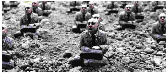
Un'opera di Isaac Cordal, da «Cement Eclipse»

nell'introduzione del libro, «è in pieno degrado. Non vediamo in altri paesi quello che accade qui da noi, ovvero il paesaggio devastato che offre l'attuale panorama politico. L'ultima anomalia del caso italiano ci ha regalato L'Uomo Qualunque al governo».