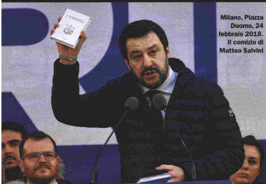
Milano, Piazza Duomo, 24 febbraio 2018. Il comizio di Matteo Salvini

forma di umanità i cui simboli sono i muri, il filo spinato, i porti chiusi.