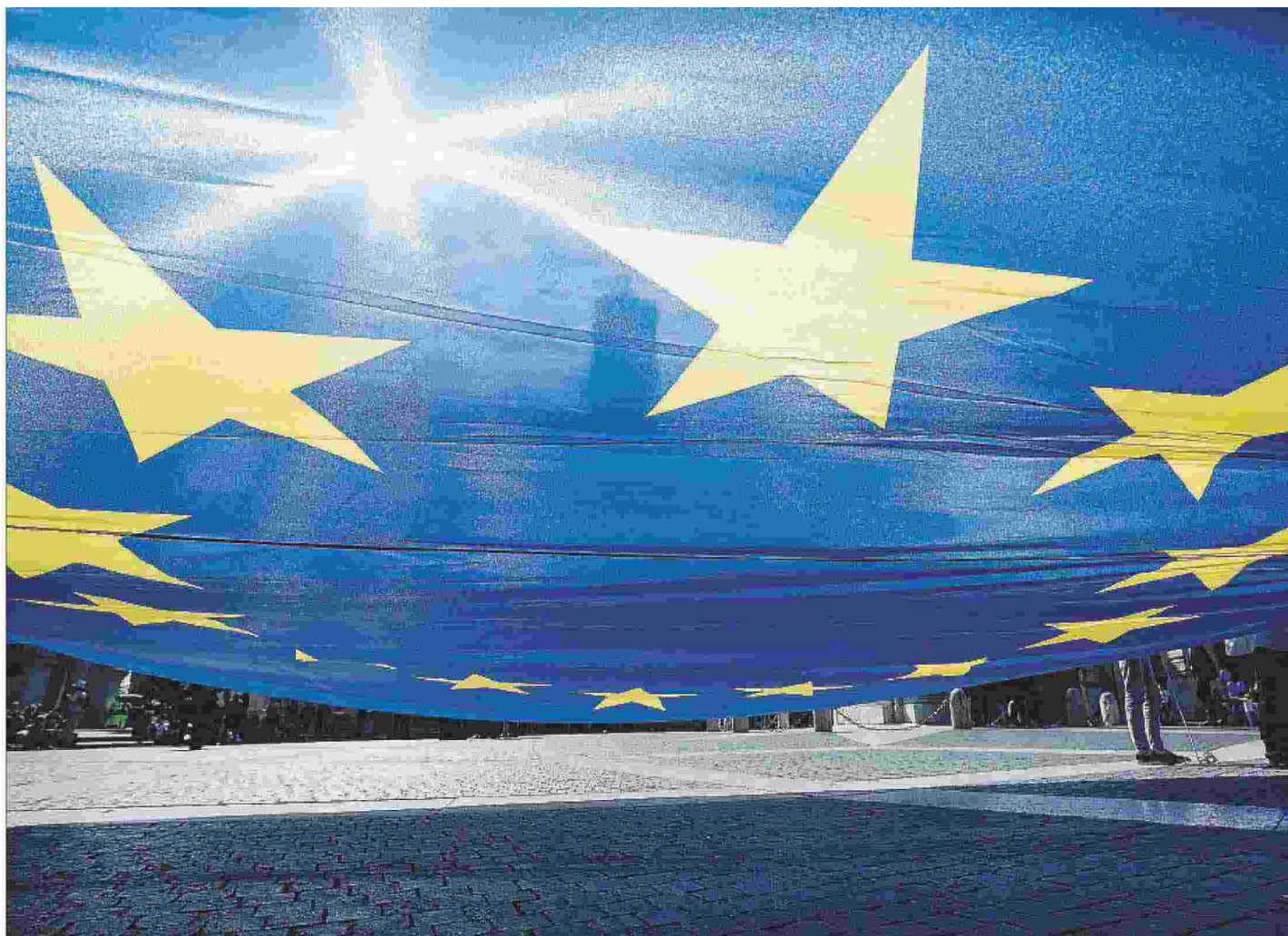
“Il favor per l'Europa è sempre e invariabilmente più largo fra i giovani, in misura tale da portare a concludere che i giovani, specie quelli scolarizzati, sono, in realtà, europeisti”