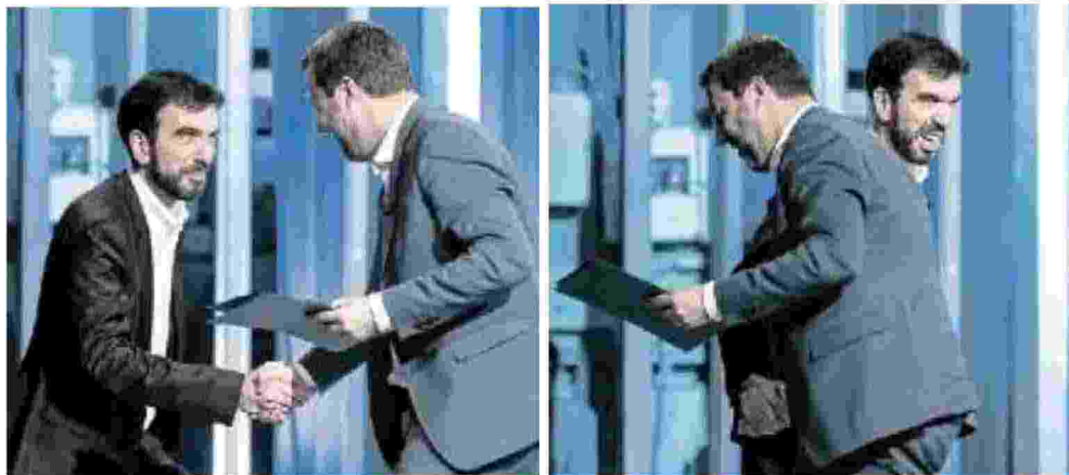
Il saluto tra Matteo Salvini e Maurizio Martina dietro le quinte della trasmissione Mezz'Orsa in più. La smorfia di dolore di Martina dopo la stretta "vigorosa" alla Trump di Salvini