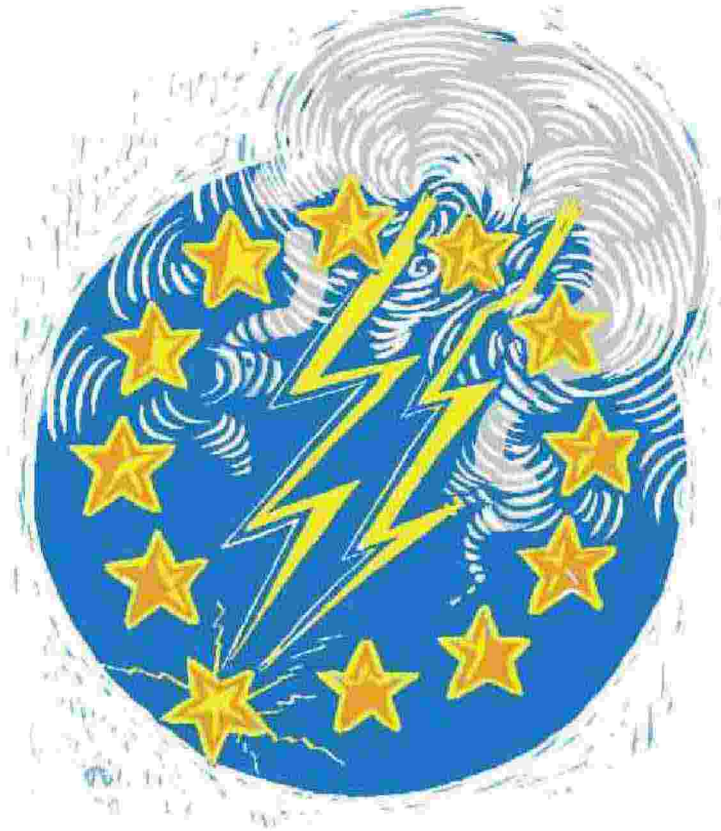
Illustrazione di Massimo Jatosti