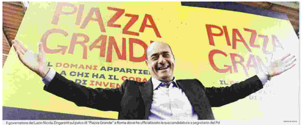
Il governatore del Lazio Nicola Zingaretti sul palco di "Piazza Grande" a Roma dove ha ufficializzato la sua candidatura a segretario del Pd

“ Largo alla green economy. Le parti del Jobs act che non hanno funzionato vanno modificate. L'età della pensione va resa flessibile in modo equo