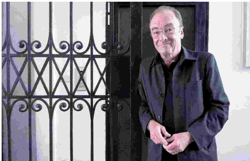
SULLA SOGLIA. Lo scrittore austriaco Robert Menasse: con «La capitale» (Sellerio) ha vinto il Deutscher Buchpreis (Giorgio Bostà)

Bilancio positivo per la 22ma edizione del Festivaletteratura di Mantova, conclusosi domenica con un totale di 122mila presenze (62mila negli incontri a pagamento, 60mila in quelli gratuiti). Un dato significativo, perché conferma la fedeltà e l'assiduità del pubblico a dispetto della lieve riduzione degli eventi in programma. Ottimi risultati anche per la redazione web e social della manifestazione: il sito festivaletteratura.it registra un +10% rispetto al 2017, con 130mila visite e oltre 700mila pagine viste; su Facebook oltre 200mila utenti raggiunti dai contenuti e oltre 60mila interazioni con i post; oltre 350mila le impression e 11mila gli utenti raggiunti su Instagram; infine su Twitter oltre 500mila visualizzazioni dei tweet dell'account ufficiale. L'appuntamento è aesso per la 23ma edizione, che si svolgerà dal 4 all'8 settembre el 2019. (R.A.)