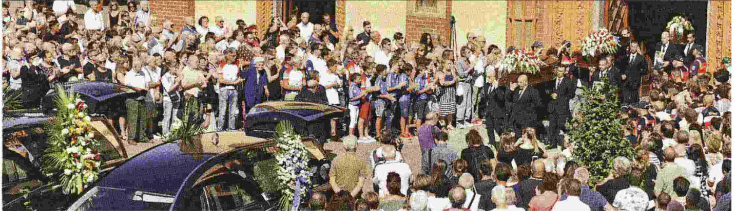
I funerali delle vittime della strage del ponte. La cerimonia, sabato scorso, è stata segnata da applausi a Di Maio e Salvini e da fischi agli ex ministri del Pd