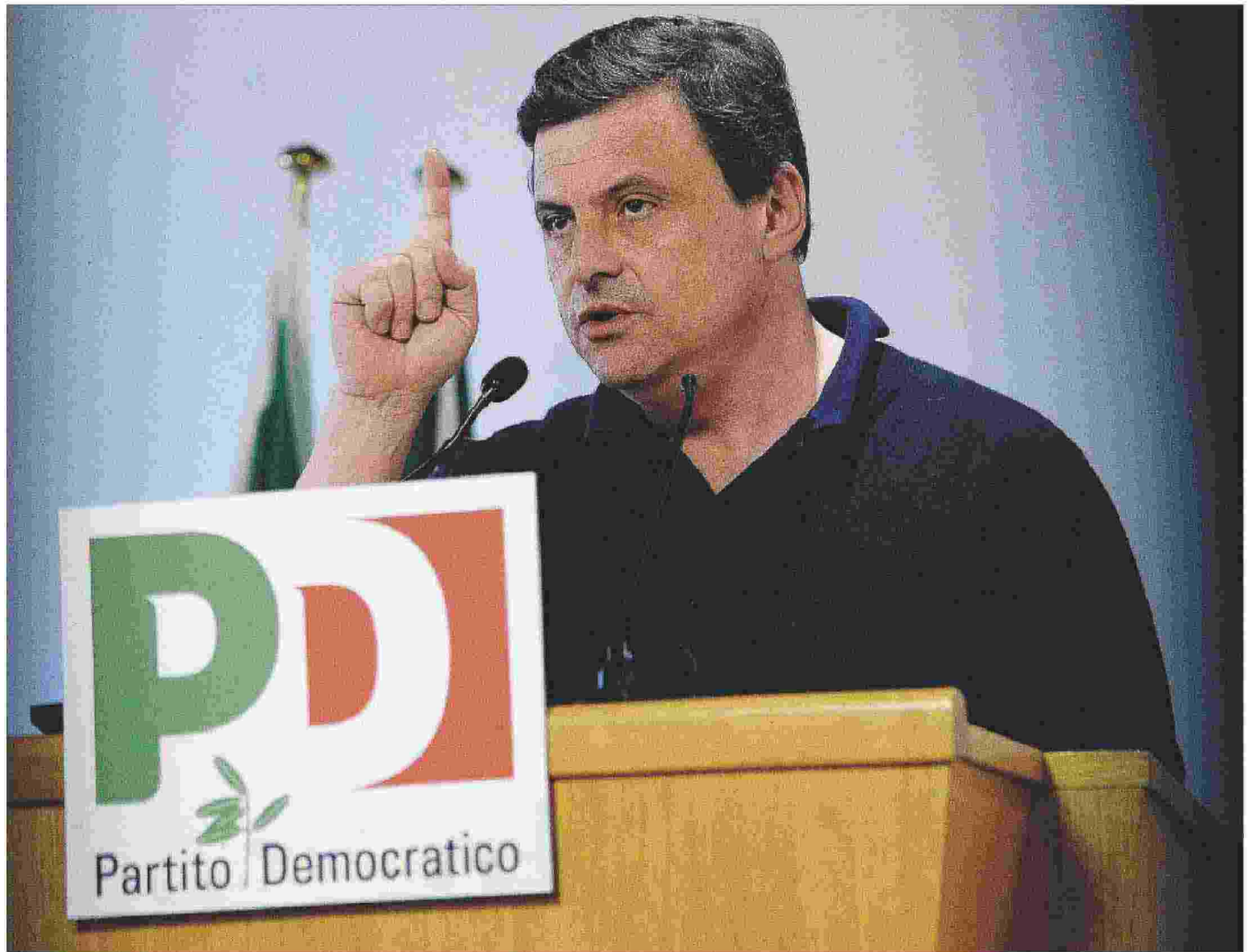
Carlo Calenda, 45 anni, è stato ministro dello Sviluppo economico dal maggio del 2016 al giugno 2018