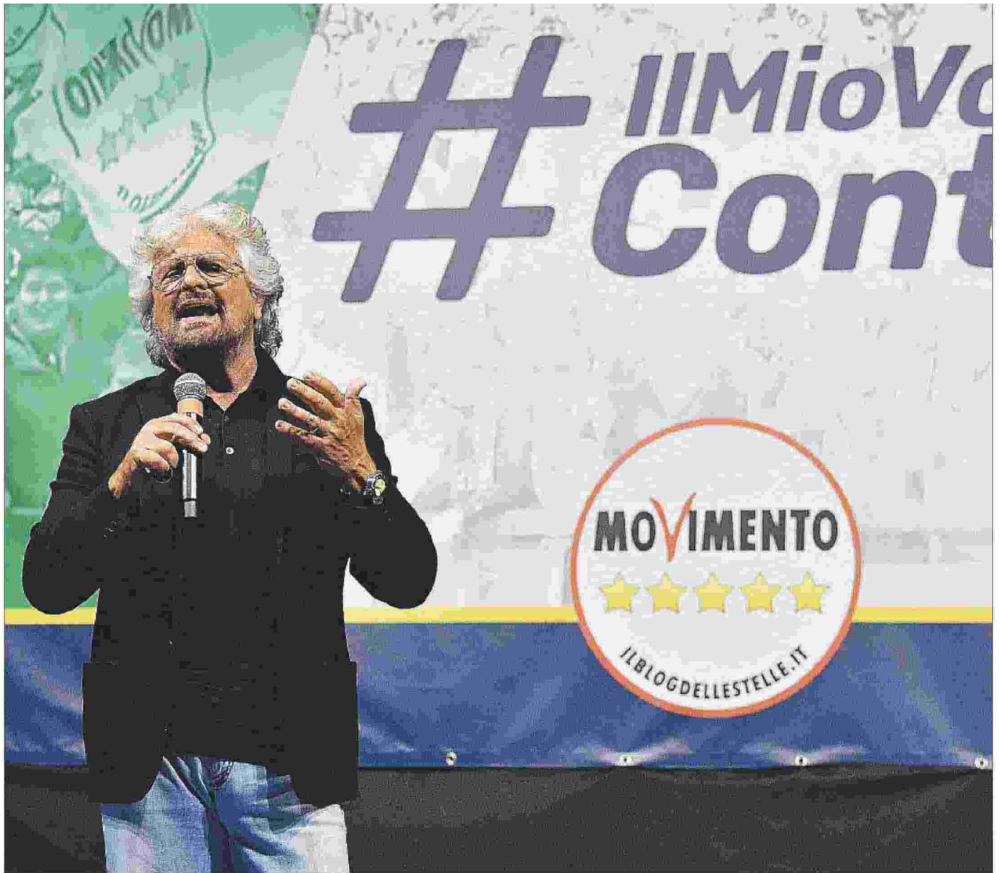
Beppe Grillo sul palco della festa del M5s per il nuovo governo, il 2 giugno scorso