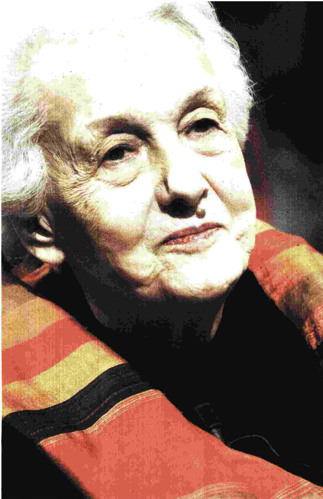
Rossana Rossanda