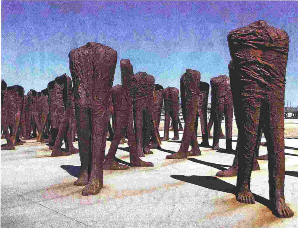
Magdalena Abakanowicz, "Bronze Crowd"

Erano altri tempi, ovviamente, e questo mio ricordo suona retorico. Ma certo mi piacerebbe che fosse così anche per lo shock che ci ha fatto vivere la sberla del 4 di marzo.