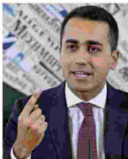
Luigi Di Maio

Luigi Di Maio parla con "Avvenire" del suo programma: «Voglio un fisco come in Francia sulla famiglia. Sbaglia chi banalizza il reddito di cittadinanza. I soldi? Sforeremo il 3% di deficit. Se noi primo partito, Mattarella mi dia l'incarico. Agli italiani dico: non temeteci».