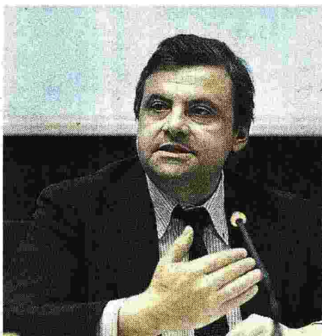
Ministro Carlo Calenda, 44 anni, allo Sviluppo economico