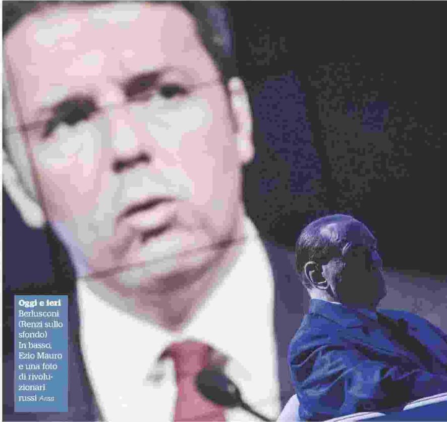
Oggi e ieri Berlusconi (Renzi sullo sfondo) In basso, Ezio Mauro e una foto di rivolu- zionari russi