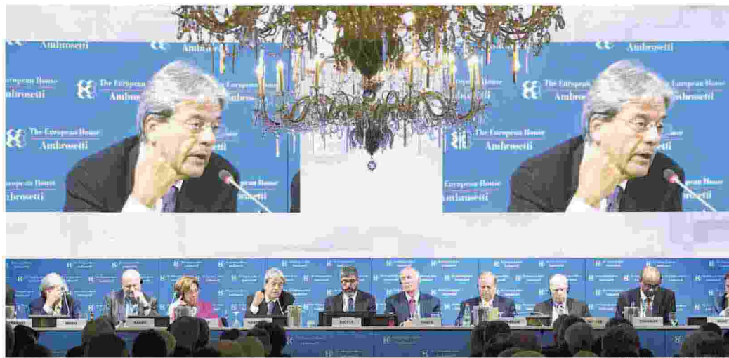
A CONFRONTO Il presidente del Consiglio, Paolo Gentiloni, ieri al Forum di Cernobbio