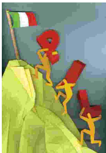
Illustrazione di Gianni Chiostrì