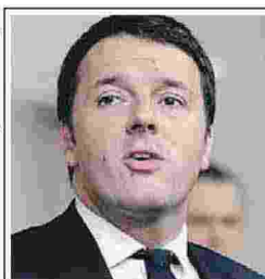
Matteo Renzi