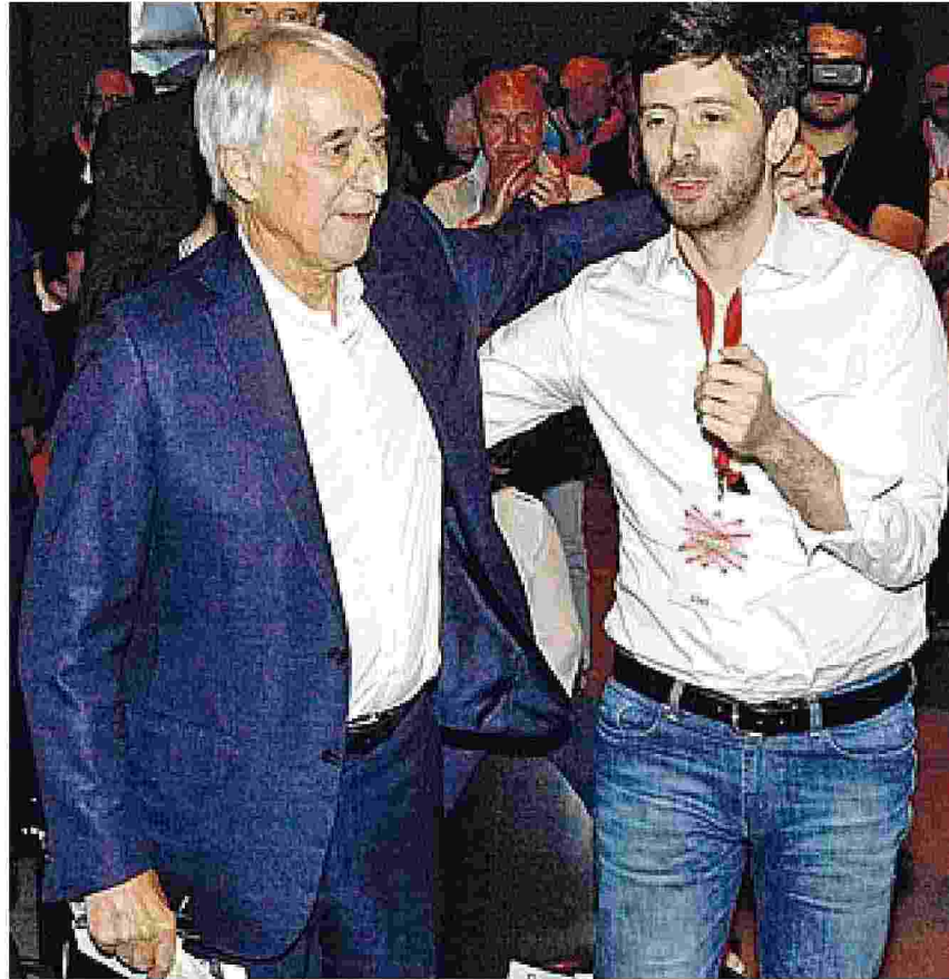
A Milano Giuliano Pisapia, 68 anni, e Roberto Speranza, 38, alla convention di Mdp

(partito nato nel 2015 dal fuoriuscito pd Pippo Civati, che ne è il segretario) — i deputati sono 17. Il gruppo al Senato fa parte del Misto e conta 8 senatori