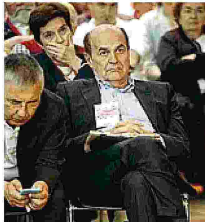
In platea Pier Luigi Bersani, 65 anni