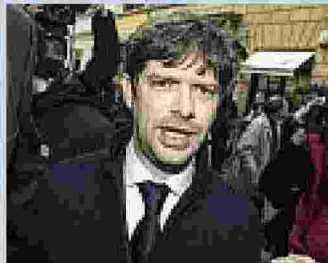
Possibile Pippo Civati, 41 anni