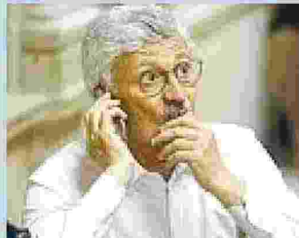
Mdp Massimo D'Alema, 68 anni