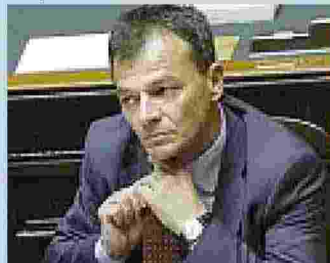
Si Stefano Fassina, 51 anni