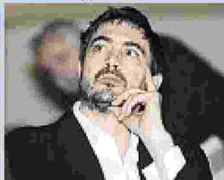
Si Nicola Fratoianni, 44 anni