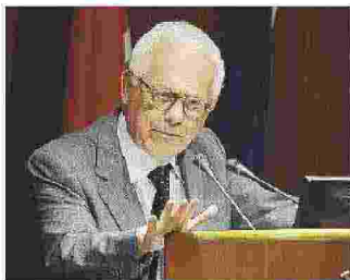
◉ CAPORALE A PAG. 4

Visco: "Noi vecchi? I presunti giovani fanno solo disastri"