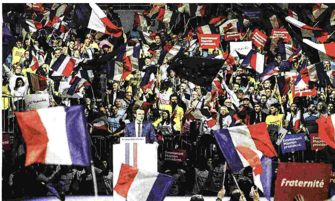
In campagna L'ex ministro dell'Economia francese, Emmanuel Macron, candidato alle presidenziali col suo movimento «En marche!», ieri a Lione