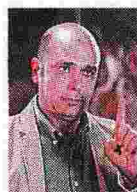
Comico Checco Zalone, 39 anni

Le note del brano «La prima Repubblica» di Checco Zalone sono risuonate nei saloni dell'hotel Ergife di Roma in apertura dell'assemblea del Pd. La scelta di usare il brano del comico tratto dal film Quo Vado pare sia del segretario Matteo Renzi che avrebbe chiesto allo stesso Zalone l'autorizzazione.