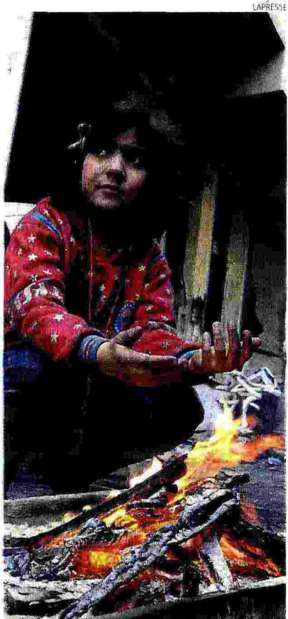
Al freddo. Una bambina di Aleppo est