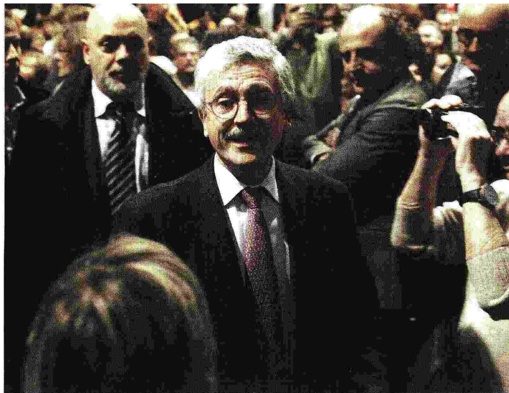
Per il No Massimo D'Alema, 67 anni, sostiene le ragioni del No attraverso iniziative in tutta Italia

I diplomatici e il voto Bisogna vigilare sul voto all'estero. Spero che i diplomatici italiani si ricordino di essere al servizio dello Stato e non del governo