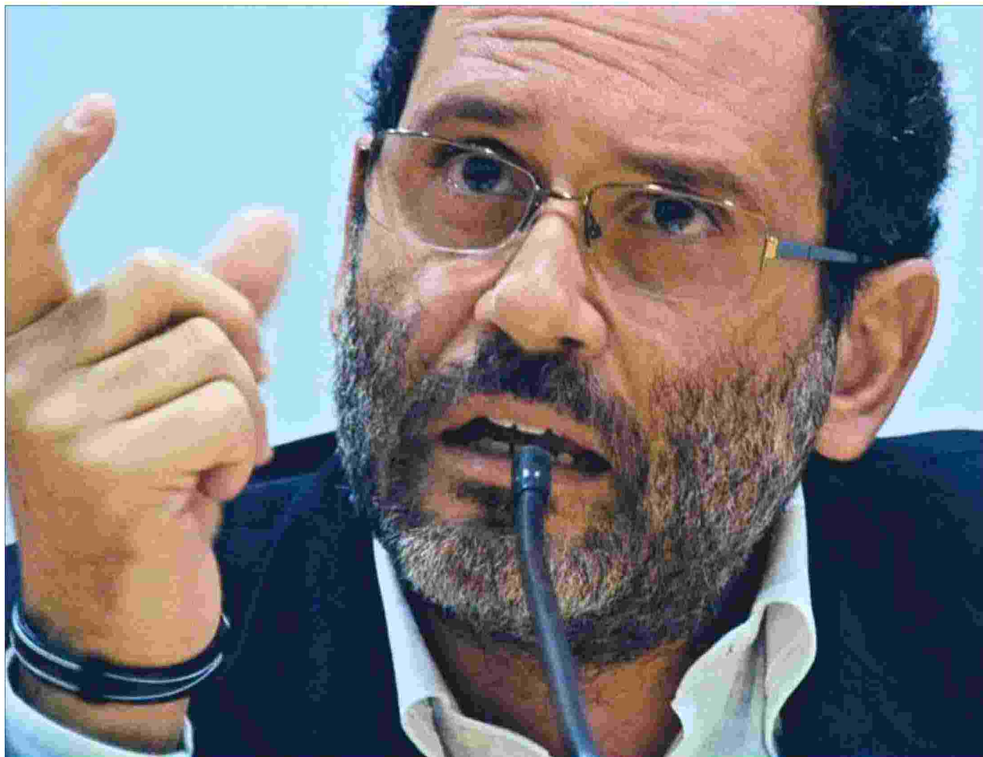
Antonio Ingroia, ex magistrato alla procura di Palermo, oggi è a capo del movimento "Azione civile" ed è impegnato contro la riforma costituzionale