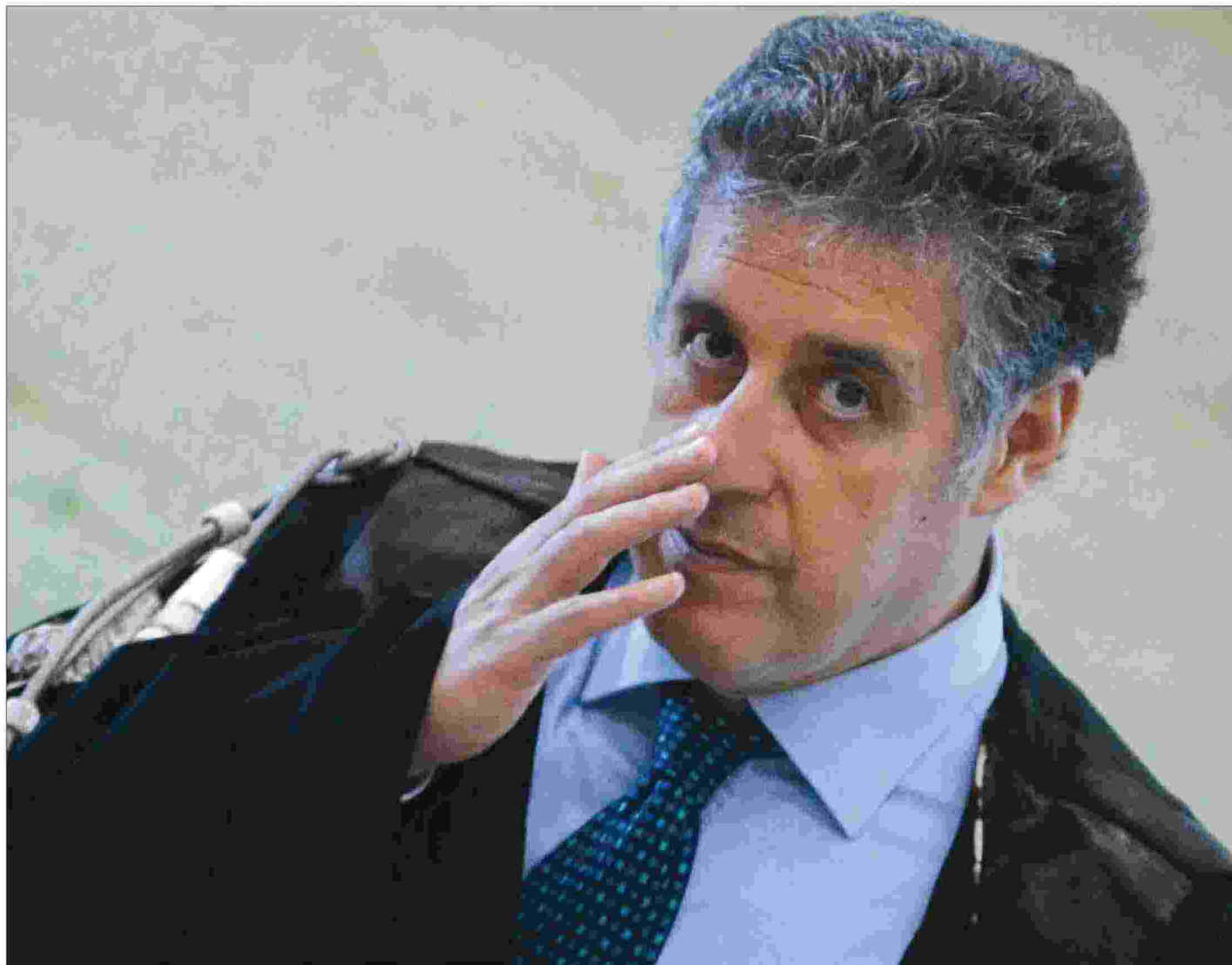
Antonino Di Matteo dal 2012 è presidente dell'Associazione Nazionale Magistrati di Palermo