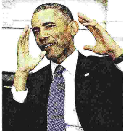
WASHINGTON Prima della crisi ucraina, Obama aveva definito la Russia "potenza regionale"