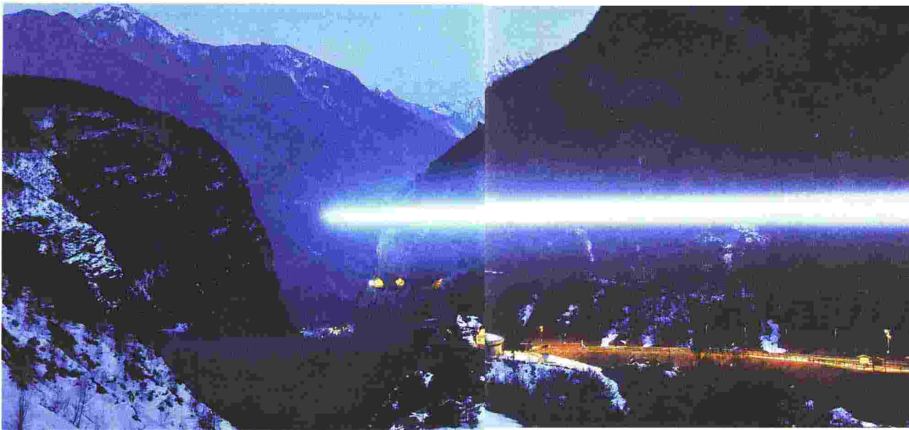
Stefano Cagol (Trento, 1969), La fine del confine (2013), courtesy dell'artista: il progetto si basava su raggi luminosi lunghi 15 chilometri che attraversavano la dorsale delle Dolomiti per rendere omaggio alla storia italiana. Il primo era stato proiettato sopra la diga del Vajont

e ideologie; quando questi flussi trovano spazi locali in cui assestarsi subiscono un processo di «indigenizzazione», in cui devono necessariamente ricostruire la propria specificità, generando nuova differenza anziché omologazione. Tra i libri più rilevanti, Fear of Small Numbers: An Essay on the Geography of Anger (Duke University Press, 2006) e The Future as Cultural Fact: Essays on the Global Condition (Verso, 2013; in italiano Il futuro come fatto culturale , Raffaello Cortina, 2014), in cui lo studioso propone, tra l'altro, che l'antropologia si occupi non solo del passato ma anche della dimensione dell'avvenire