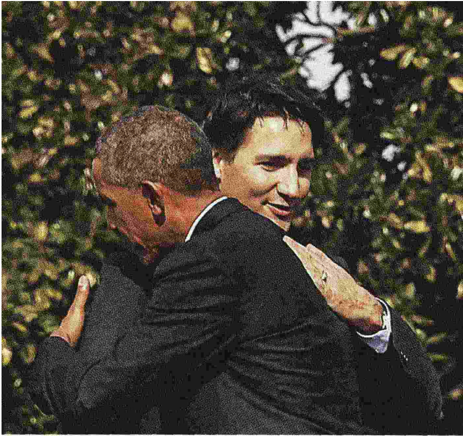
L'abbraccio di ieri tra Barack Obama e il primo ministro del Canada Justin Trudeau