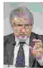
Poletti Il ministro del Lavoro del governo Renzi, Giuliano Poletti