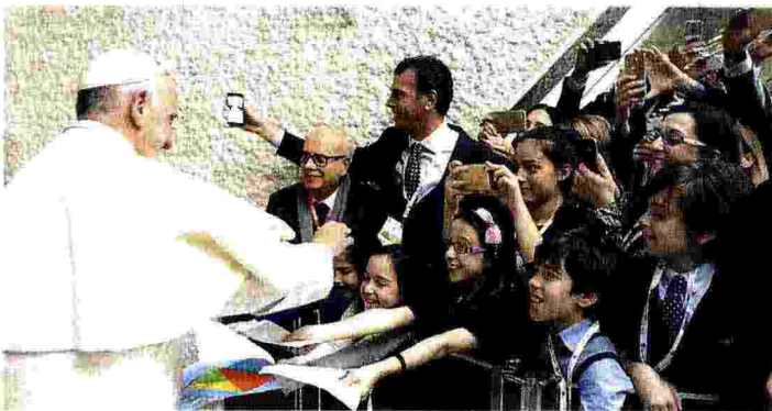
L'udienza. Papa Bergoglio al momento del suo ingresso in Sala Nervi (sopra) e nell'incontro con le famiglie degli imprenditori (a sinistra). La stretta di mano con il cardinale Gianfranco Ravasi (a destra).