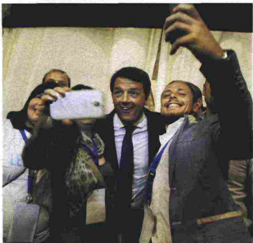
Selfie con Matteo Renzi alla Leopolda