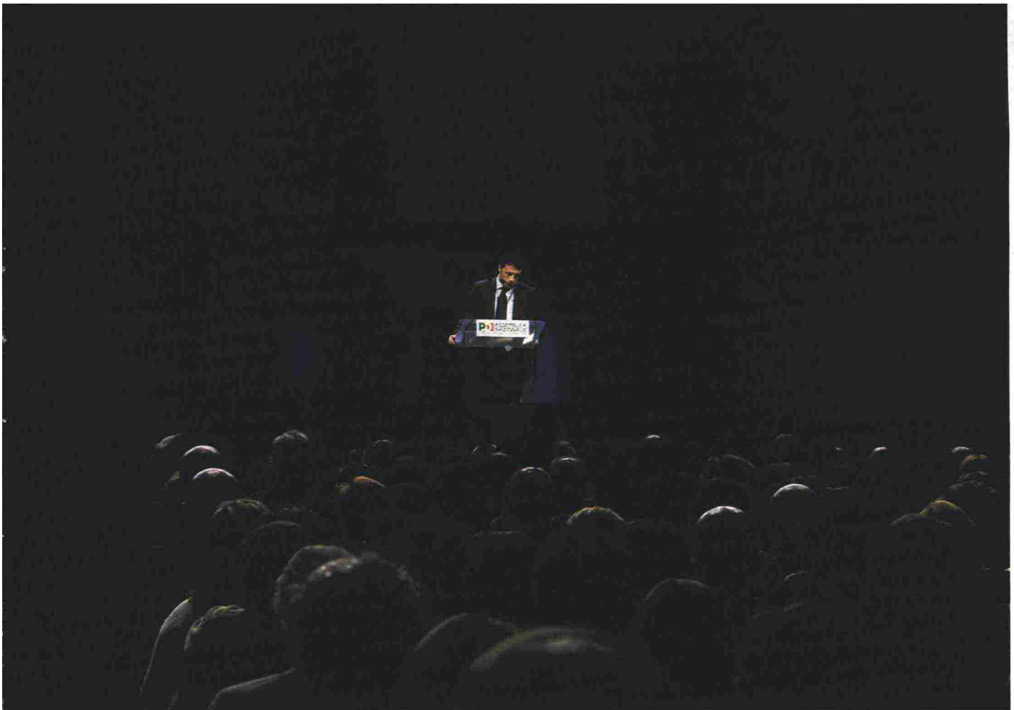
Il presidente del Consiglio, Matteo Renzi, parla a un'assemblea del Pd