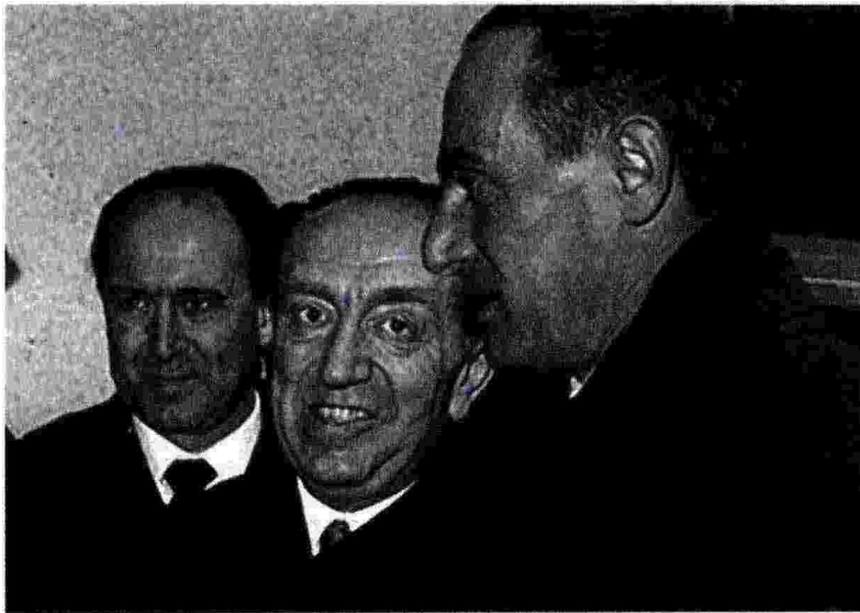
Anni 50. Ezio Vanoni (al centro), allora ministro delle Finanze, con (a destra) Enrico Mattei