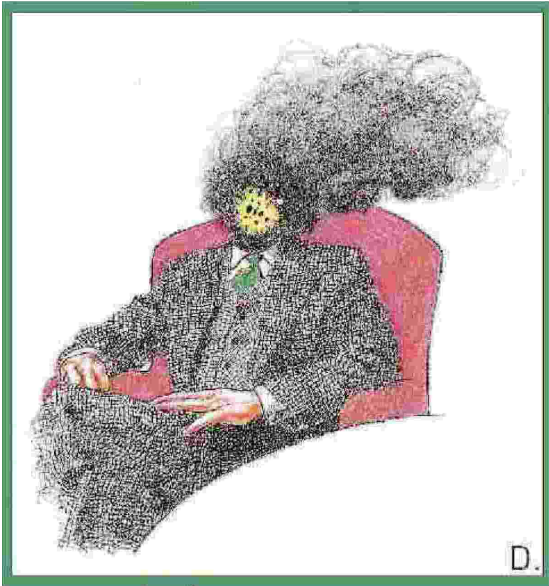
Illustrazione di Dariush Radpour