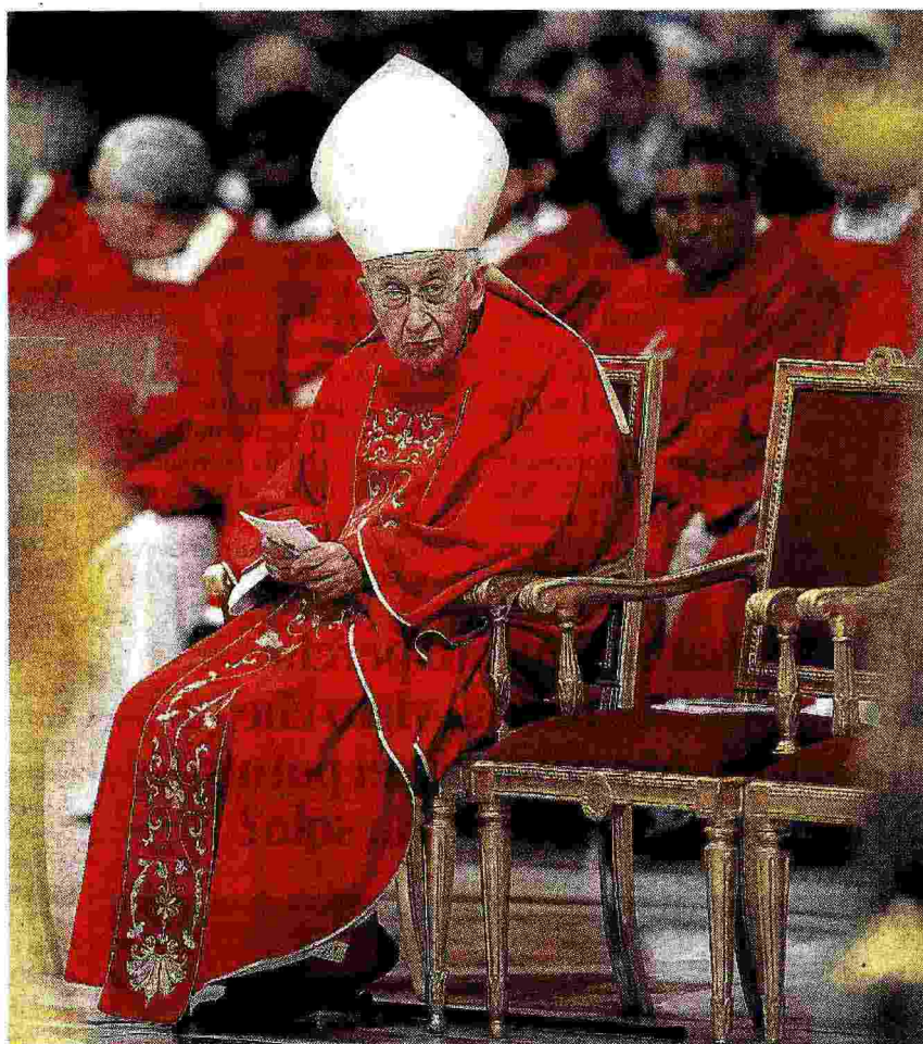
A San Pietro Il cardinale Camillo Ruini, 84 anni, alla messa di Pentecoste dello scorso 24 maggio

Il cardinale Caffarra ha evidenziato le condizioni senza le quali l'accoglienza dei migranti diventa difficile