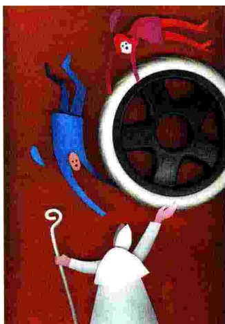
Illustrazione di Gianni Chiostri

ti della promessa di fedeltà fatta di fronte all'altare. Al riguardo il Papa parla di «mancanza di fede», per indicare l'assenza di una condizione base del matrimonio cristiano: quella per cui ci si sposa per sempre, ci si promette una fedeltà reciproca nel tempo, da vivere anche negli alti e bassi di un rapporto di coppia. Pur eclatante, non si tratta di un'indicazione del tutto nuova negli orientamenti della Chiesa di Roma, in quanto questo principio era già stato affermato da Benedetto XVI, il cui insegnamento quindi viene ripreso e rafforzato da Papa Bergoglio. Tuttavia si può ben comprendere il carattere dirompente di questa causa di nullità matrimoniale, considerando quanti «fedeli» o «cattolici» si accostano al sacramento del matrimonio avendo convinzioni incerte o vaghe sulla questione dell'indissolubilità dell'unione che pur hanno scelto di contrarre di fronte a Dio.