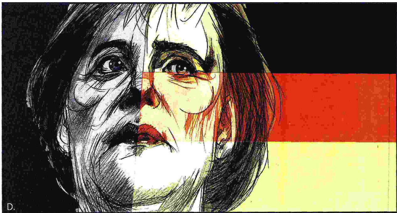
Illustrazione di Dariush Radpour