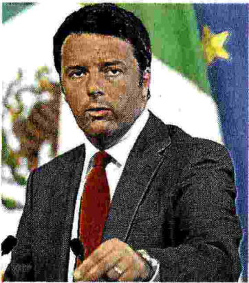
Matteo Renzi

«SIAMO IN PISTA SUL GIUBILEO, SULLE OLIMPIADI, SULLE INFRASTRUTTURE... PURCHÉ DAL COMUNE ARRIVINO PROPOSTE»