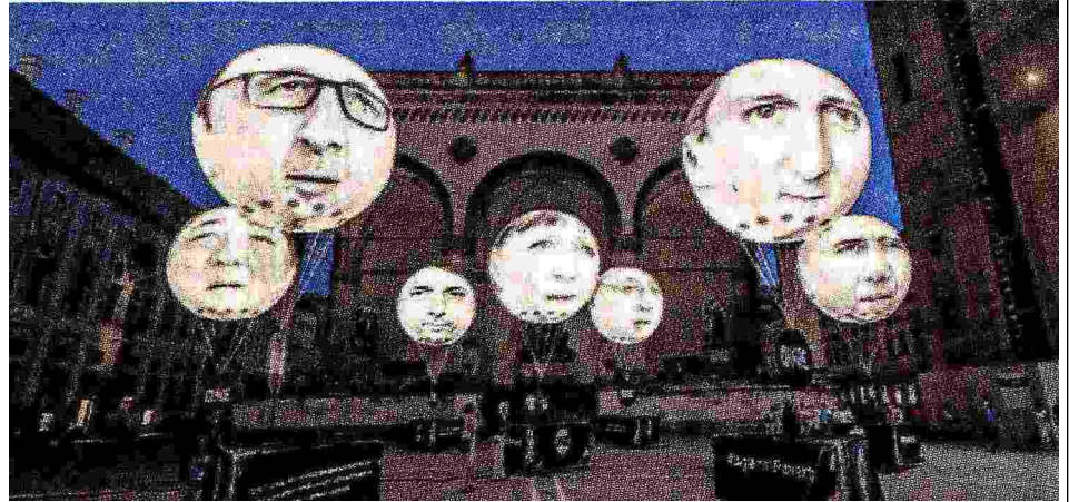
LA CAMPAGNA Protesta in piazza a Monaco con palloncini che raffigurano i sette leader riuniti per l'incontro