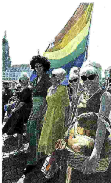
DRESDA Il gay pride di sabato scorso